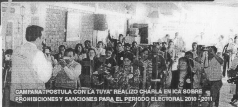
CAMPAÑA "POSTULA CON LA TUYA" REALIZO CHARLA EN ICA SOBRE PROHIBICIONES Y SANCIONES PARA EL PERIODO ELECTORAL 2010 - 2011